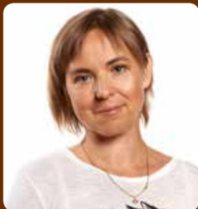
TAGLI PITSI, Tervise Aengu Instituudi toitumiseksper

Kuna me kipume küllastunud rasvhappeid saama suhteliselt palju ka piima- ja lihatoodetest, siis peaks kindlasti jälgima seda, et päeva jooksul kokku ei annaks need üle 10% energiast (2000 kcal juures tähendaks see mitte üle 22 g küllastunud rasvhappeid keskmiselt päeva kohta).