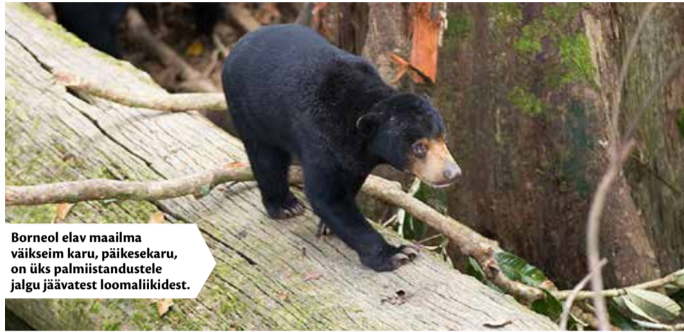
Borneol elav maailma väikseim karu, päikesekaru, on üks palmiistandustele jalgu jäävatest loomaliikidest.

Plaanid on siiski head ja pingutused tehtud – Kesko eesmärk on aastaks 2020 kasutada oma toodetes ainult sertifitseeritud palmiõli. Valio on aga otsustanud palmiõli enam mitte kasutada, Paulig plaanib minna üle päevalilleõlile. See küll hoiab ära jõuvõtetega toodetud palmiõli ostmise, kuid ei aita kuidagi kaasa nende võtete paranemisele. Ja kuigi paljud ettevõtteid toorainevahetuse põhjuseks soovi kasutada kodumaist, on üpris tõenäoline, et oma põhjuse on sel-