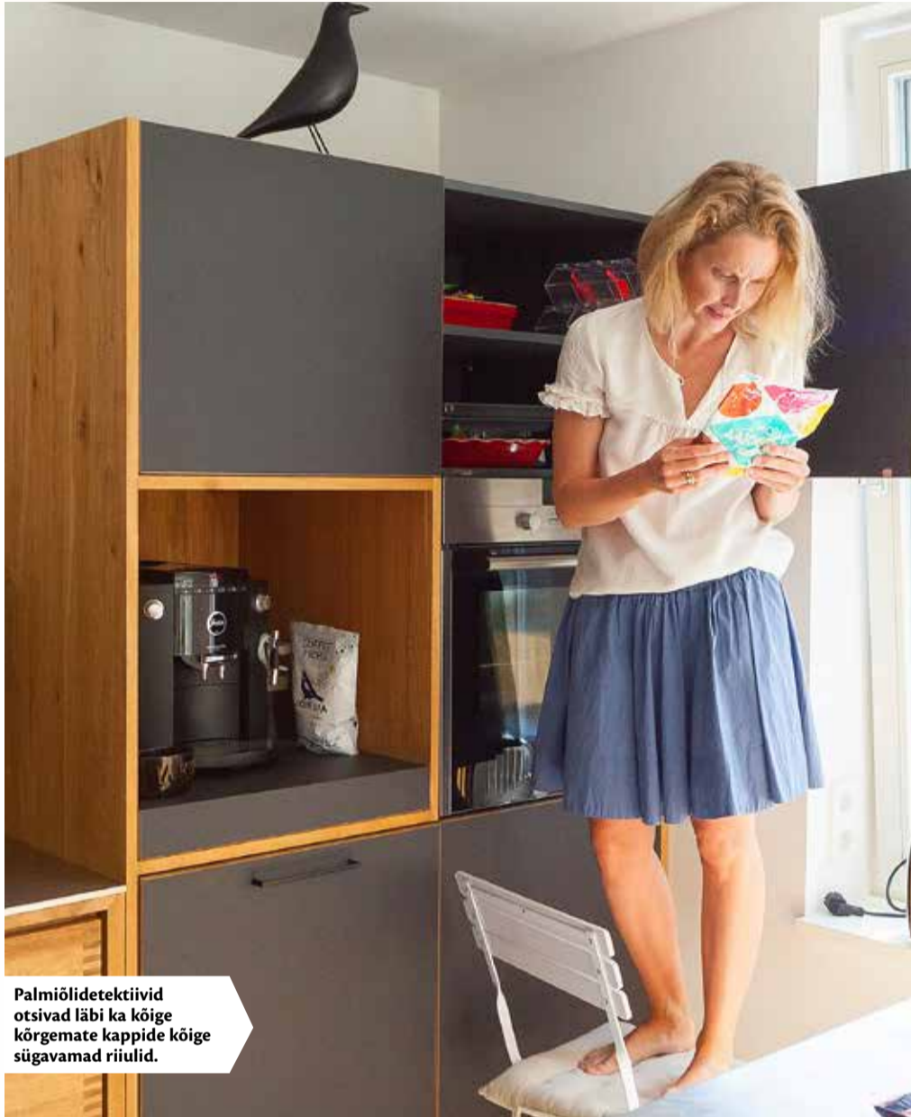
Palmiõli detektiivid otsivad läbi ka kõige kõrgemate kappide kõige sügavamad riiulid.

Vahepeal on valmis saanud kohv ja perenaine pakub joo- gi tempimiseks nii suhkrut kui ka piima. Tavalise piima kõrval vaatavad külmkapist vastu veel kitse- ja mandlipiim. Sel- list teadlikkust ja tervislikkust vist väga tihti Eesti kodudes ei näe, täheldan endamisi. „Mina joon kohvi kitsepiimaga, sest tavapiim tundub liiga magus,” märgib näitlejanna.