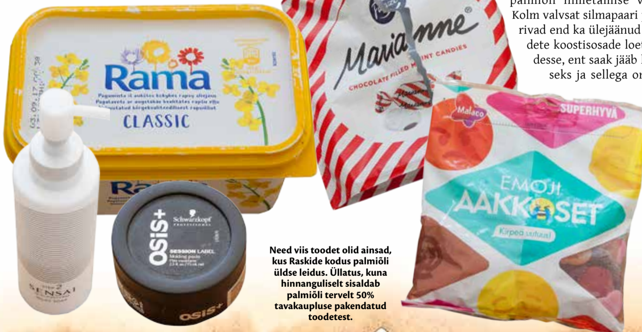
Need viis toodet olid ainsad, kus Raskide kodus palmiõli üldse leidis. Üllatus, kuna hinnanguliselt sisaldab palmiõli tervelt 50% tavakaupluse pakendatud toodetest.

näitus „Palmi all”, mis räägib palmiõli loo. Näitust saab tellida kooli, raamatukokku või asutusse http://www.maailmakool.ee/ näitus-palmi-all-raagib-palmiõli-loo/. Mondo Maailmakooli filmikogus on ka film Green, mis räägib orangutani viimastest päevadest Indoneesia vihmametsas, enne kui see muudetakse lageraiega palmiistanduseks. Seda saab tellida http://www.maailmakool.ee/filmid/mondo-filmikogu/ .